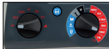
interrupteur rotatif pour une utilisation intuitive sur le terrain