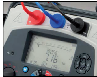
Grand écran LCD rétro-éclairé

Les isolamètres de qualité assurent une montée rapide de la tension aux niveaux de résistance minimaux acceptables, tout en garantissant une grande stabilité de la tension pendant la mesure. Au-dessous d'un niveau minimum acceptable de résistance d'isolement, la tension doit rapidement baisser pour protéger l'équipement en essai et permettre sa remise en état.