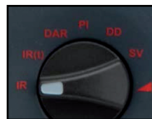
Bouton rotatif de sélection clair et précis. Comprends : IR, IR(t), DAR, PI, DD; SV et Test de Rampe